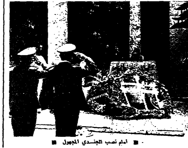
أمام نصب الجندي المجهول